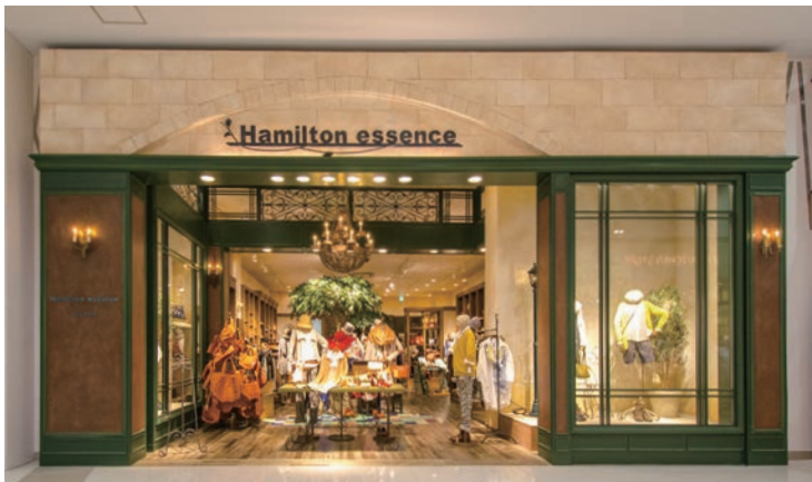
Hamilton essence 施主・設計：(株) ハミルトン 施工：大昌工芸 (株)